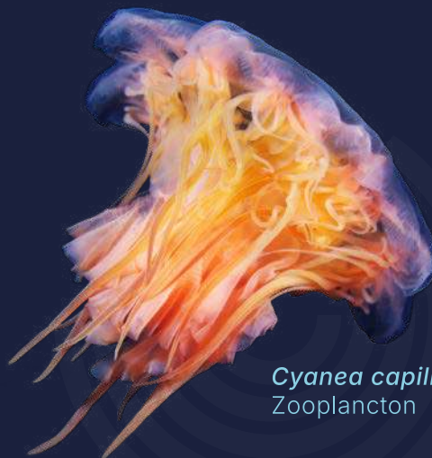
Cyanea capillata Zooplankton

L'evento, gratuito per la cittadinanza, si contraddistingue per la sua ricca agenda, per l'alto livello scientifico e innovativo dei propri contenuti.