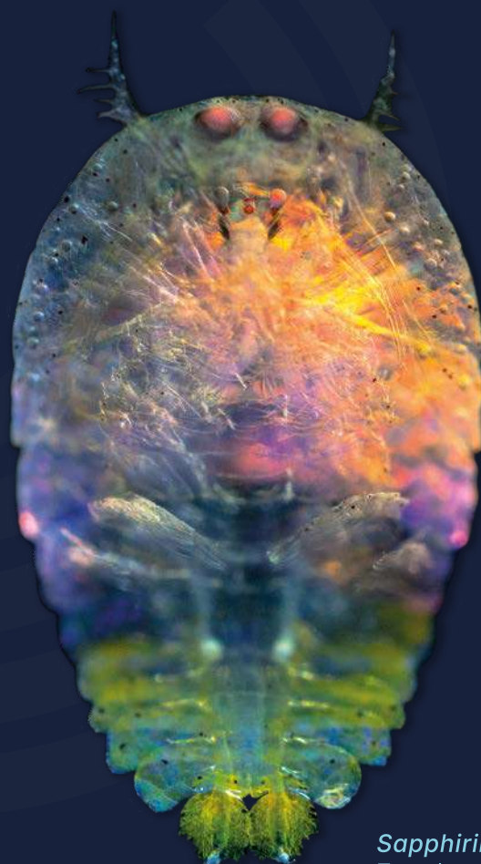
Sapphirina sp. Zooplankton